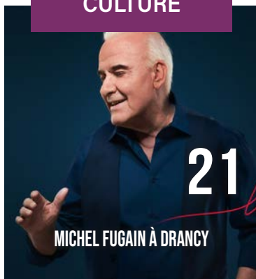
MICHEL FUGAIN À DRANCY