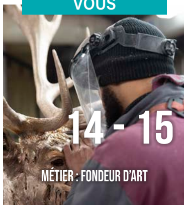
MÉTIER : FONDEUR D'ART