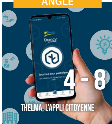
THELMA, L'APPLI CITOYENNE