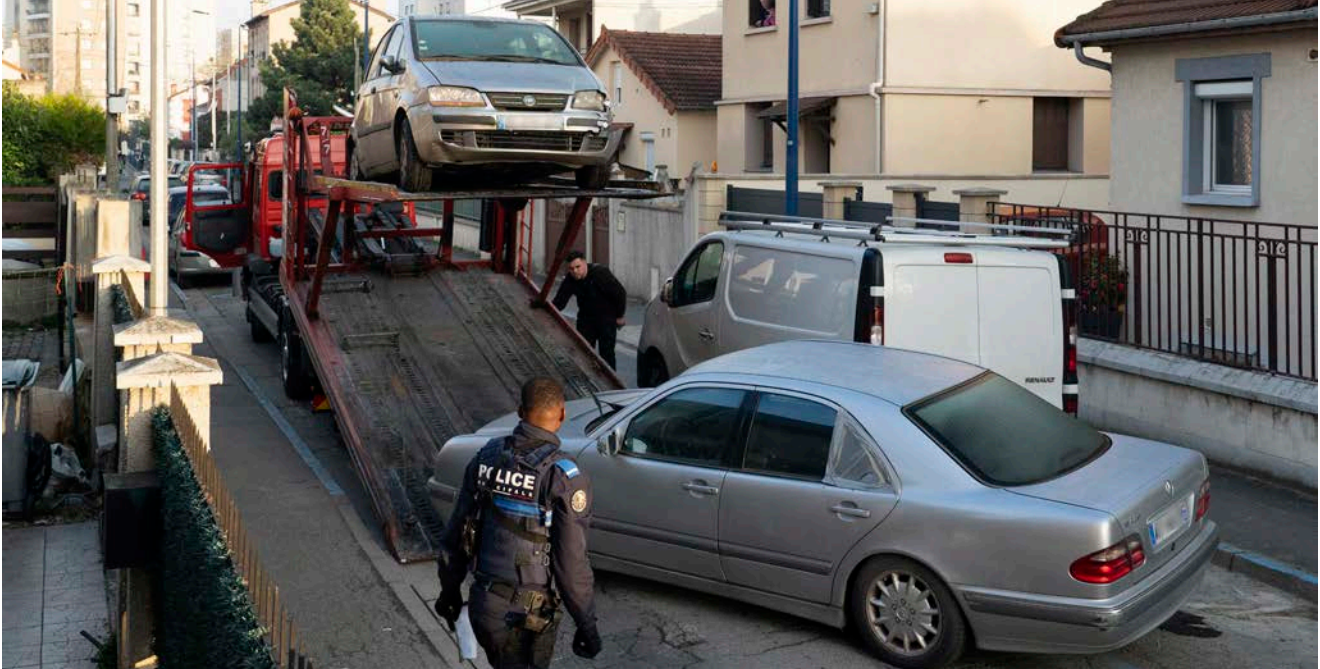
Une opération coup de balai.

signalement. Thelma appelle à une collaboration des habitants pour améliorer le cadre de vie collectif.