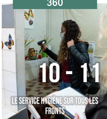
LE SERVICE HYGIÈNE SUR TOUS LES FRONTS