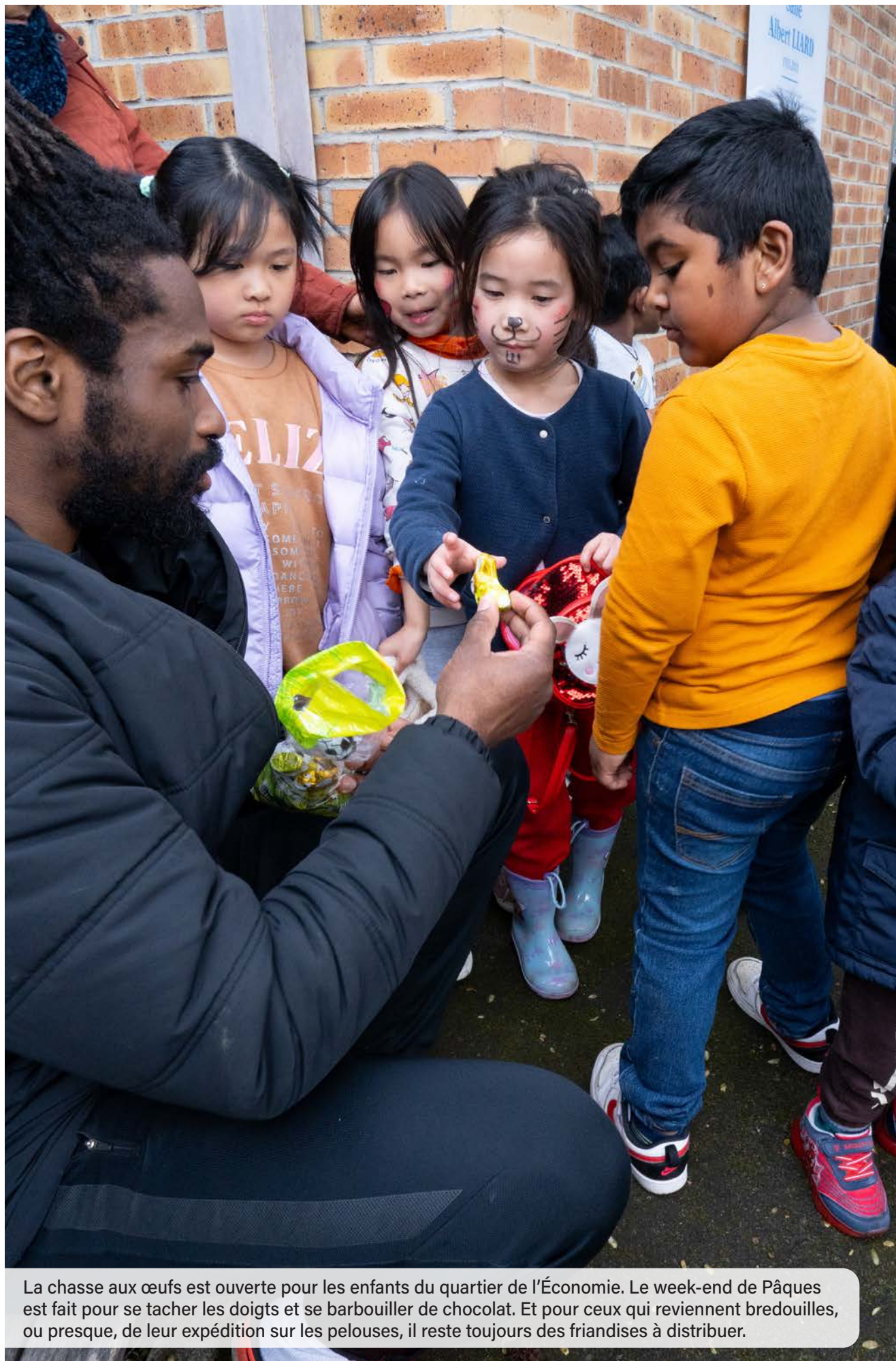
La chasse aux œufs est ouverte pour les enfants du quartier de l'Économie. Le week-end de Pâques est fait pour se tacher les doigts et se barbouiller de chocolat. Et pour ceux qui reviennent bredouilles, ou presque, de leur expédition sur les pelouses, il reste toujours des friandises à distribuer.