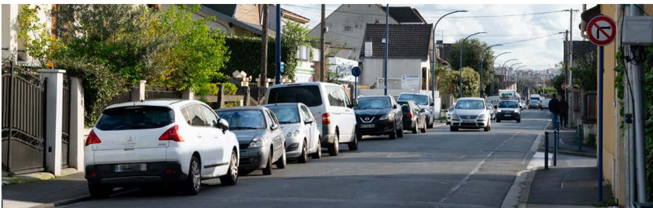
Les travaux commencent le 8 avril dans la rue de Faidherbe qui gagnera 20 places. Deux plateaux surélevés seront installés dans cette rue très empruntée pour accéder à l'A86 et là où les dépassements de vitesse étaient trop fréquents.

Alors que l'équipement automobile des Drancéens est toujours plus important, la ville met tout en œuvre pour créer de nouvelles places et faciliter le stationnement. Zoom sur cette politique innovante.