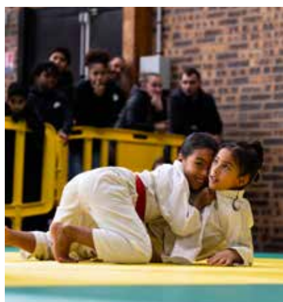
◀ Tour à tour, l'USNCD et l'ASD Judo ont organisé un tournoi à Joliot-Curie. Les jeunes combattants sont venus des quatre coins d'Île-de-France dans l'espoir de remporter une médaille.