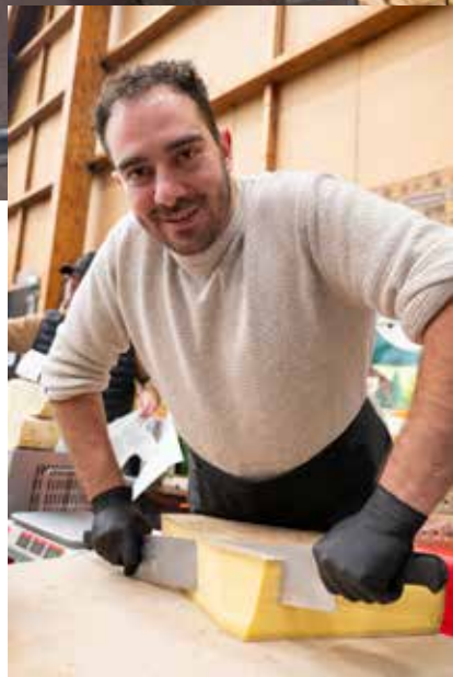
▲ Des produits de qualité et des artisans à votre écoute pour vous aiguiller dans vos choix gourmands. Le Salon du Vin et du Goût, organisé par Drancy Ville Fleurie, a, une nouvelle fois, été une grande réussite.