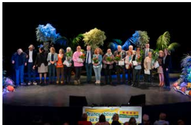
▲ 400 Drancéens ont célébré les lauréats du concours des jardins et balcons fleuris. Une soirée conviviale marquée par la présentation du panneau "4 Fleurs", symbole du travail collectif mené pour verdier la ville.