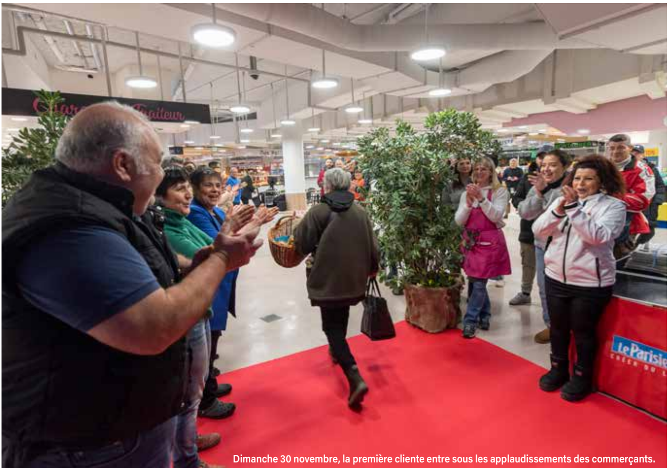
Dimanche 30 novembre, la première cliente entre sous les applaudissements des commerçants.

Subvention : 500 000 euros par la Métropole du Grand Paris