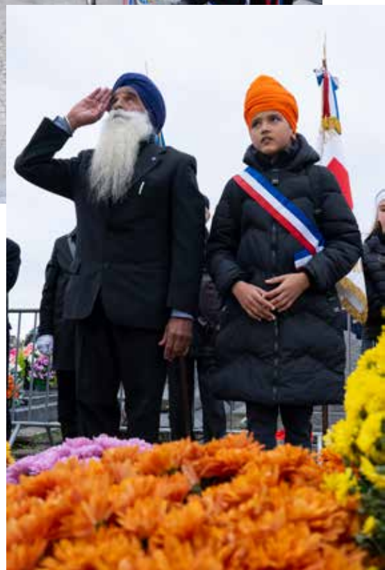
▲ Drancy a commémoré le 107 e anniversaire de l'Armistice du 11 novembre 1918. Élus, anciens combattants, porte-drapeaux, écoliers, associations et habitants se sont réunis pour honorer la mémoire de celles et ceux qui sont tombés pour la paix et la liberté.