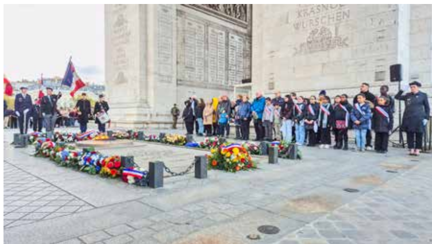
▲ Le 24 octobre, les jeunes élus du CME et des membres de l'UNRPA de Seine-Saint-Denis ont assisté au ravivage de la flamme du soldat inconnu, sous l'Arc de Triomphe. Une belle manière de leur inculquer le devoir de transmission de la mémoire.