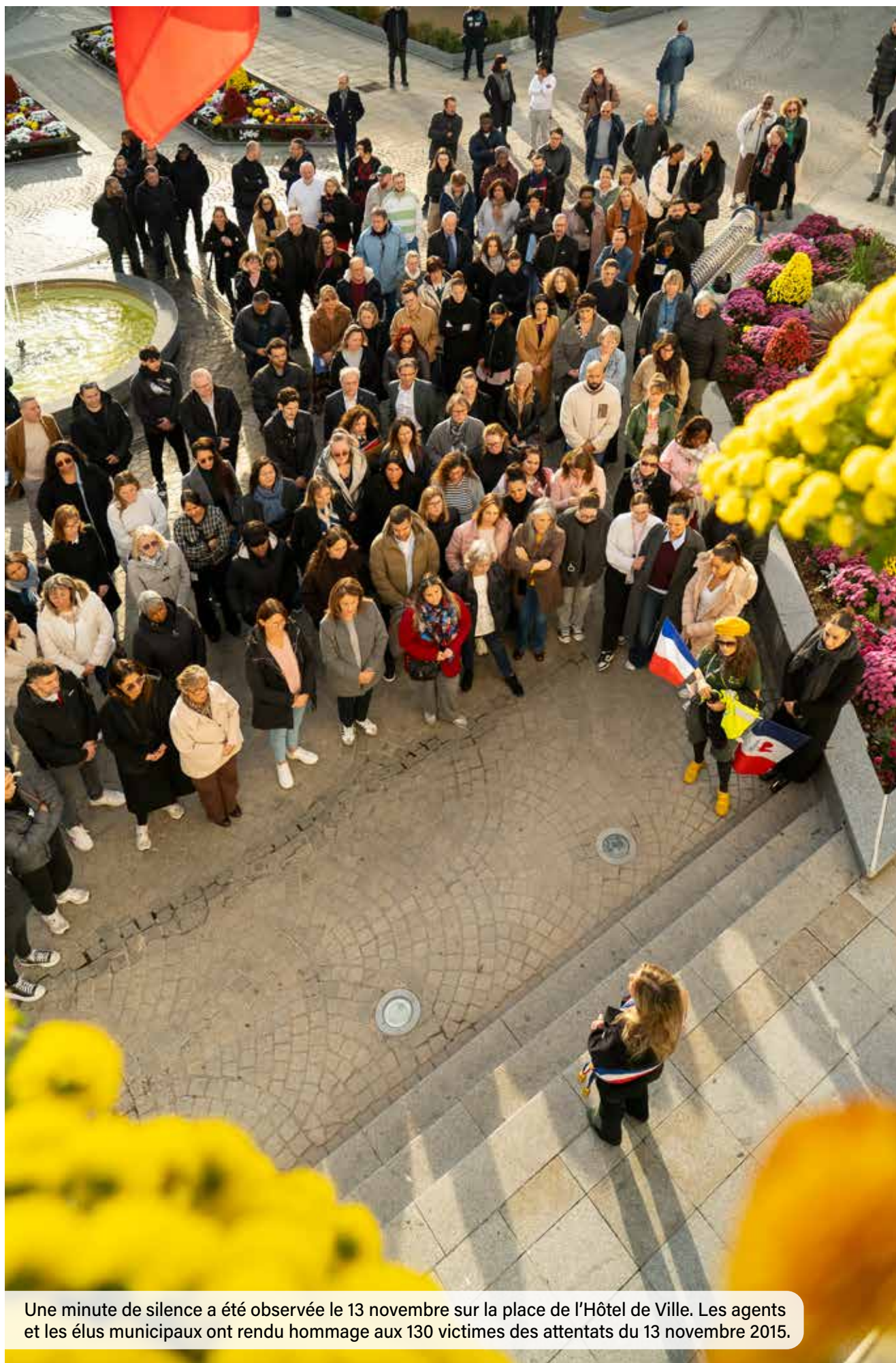
Une minute de silence a été observée le 13 novembre sur la place de l'Hôtel de Ville. Les agents et les élus municipaux ont rendu hommage aux 130 victimes des attentats du 13 novembre 2015.