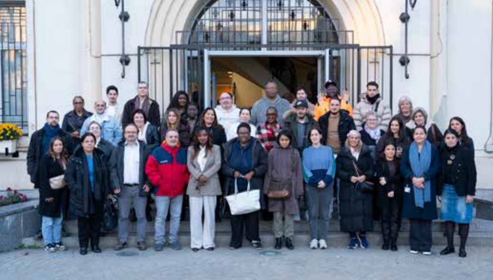
▲ À Drancy, l'inclusion se vit sur le terrain ! Pour cette 2 e édition du DuoDay, 24 personnes en situation de handicap ont partagé une journée de travail en immersion avec les agents municipaux.