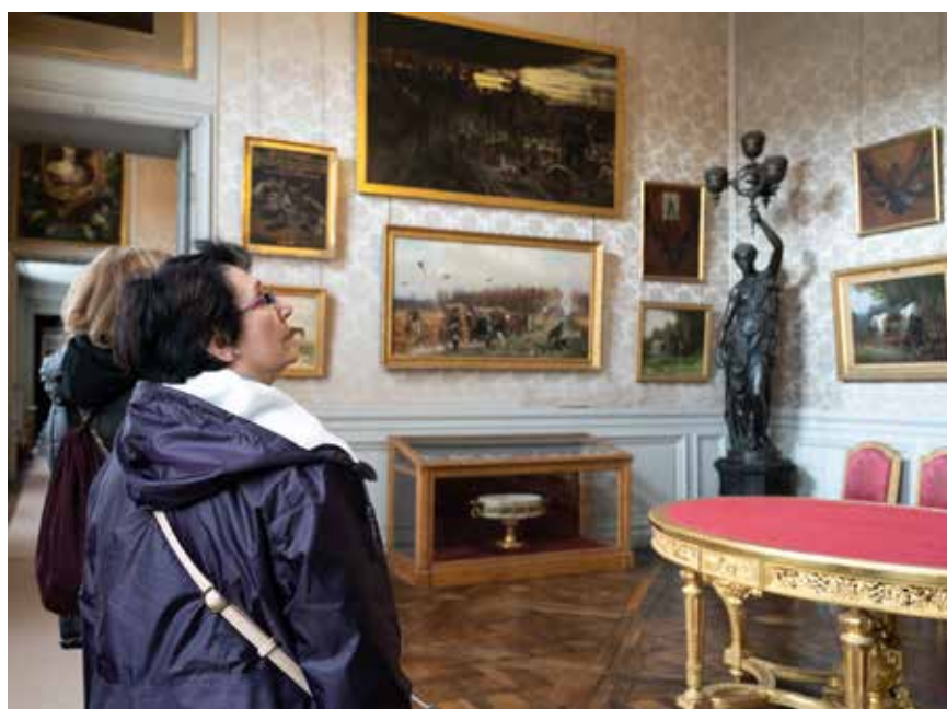
▲ La dernière sortie de nos retraités les a conduits à Compiègne. Visite du château le matin, puis, place aux plaisirs gourmands : un bon repas et une immersion dans la fabrication du chocolat.