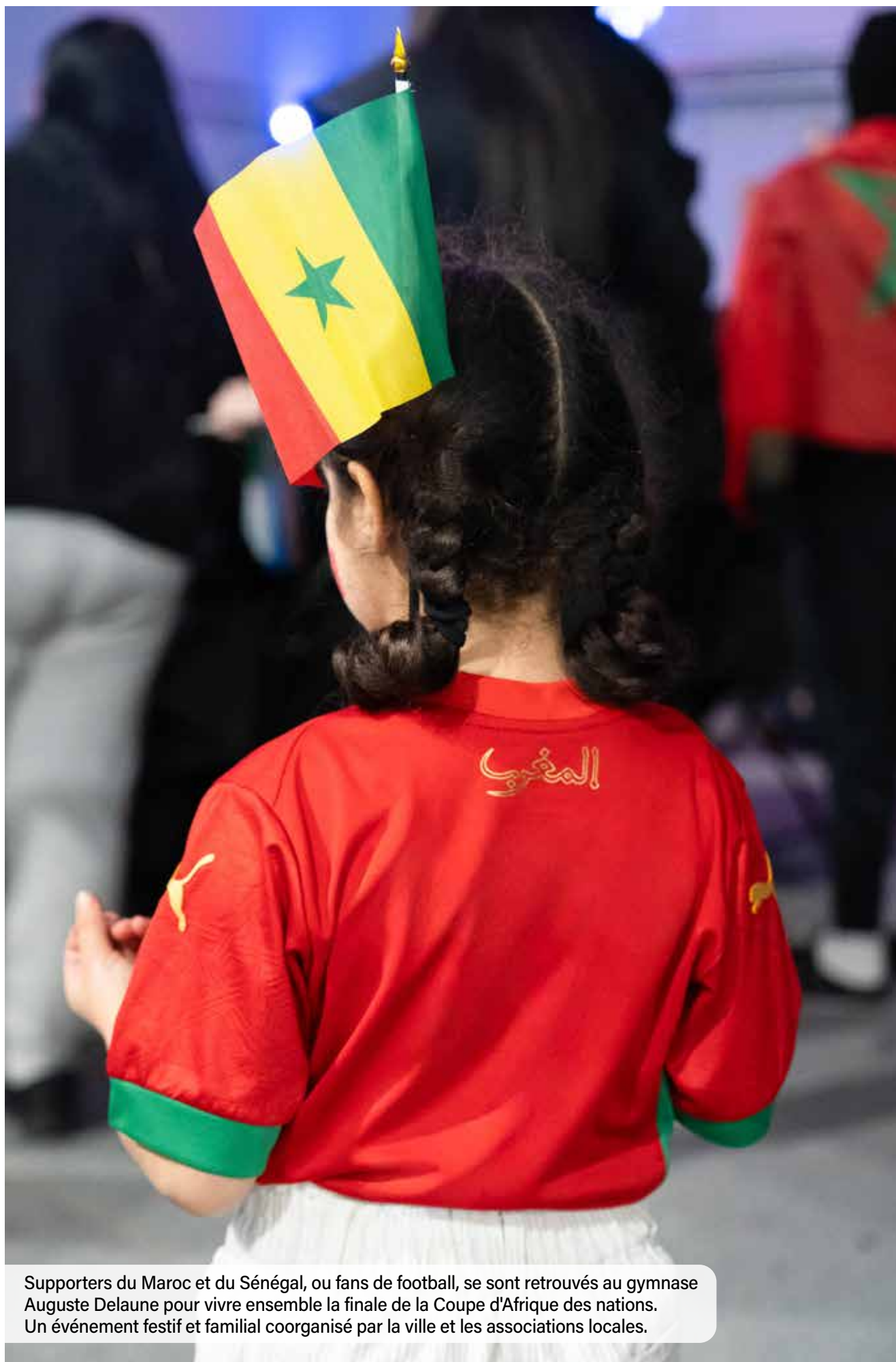
Supporters du Maroc et du Sénégal, ou fans de football, se sont retrouvés au gymnase Auguste Delaune pour vivre ensemble la finale de la Coupe d'Afrique des nations. Un événement festif et familial coorganisé par la ville et les associations locales.