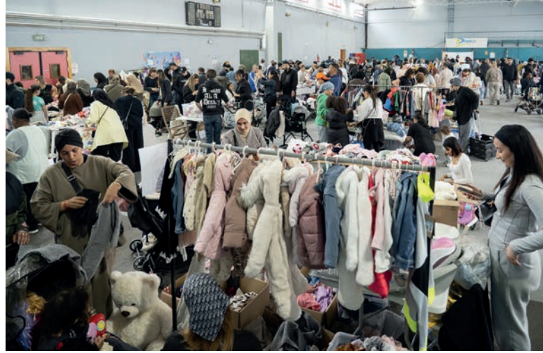
▲ Succès énorme pour la brocante spécial puériculture de Parent&moi le 3 mai, au gymnase Auguste Delaune ! Vous pouviez y trouver des vêtements enfants, des jouets et des indispensables du quotidien à petits prix.