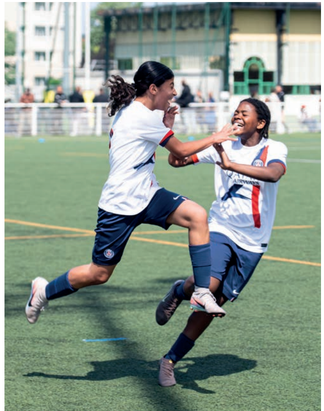
◀ ▲ Le 8 mai, la JA Drancy a organisé un grand tournoi de football à Guy Môquet pour les catégories U7/U8. Le lendemain, la finale régionale du Festival Foot U13 s'est jouée sur les mêmes installations. Paris FC, PSG ou encore Red Star se sont disputé une place en finale nationale.