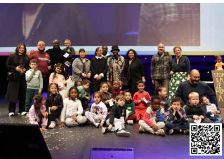
▲ Les élèves de l'école maternelle Dulcie September ont été récompensés lors du concours national Nous Autres , qui sensibilise les plus jeunes à la lutte contre le racisme. Leur projet artistique leur a permis de monter sur scène et de rencontrer le parrain du concours, Lilian Thuram ! À voir en vidéo via le QR code.