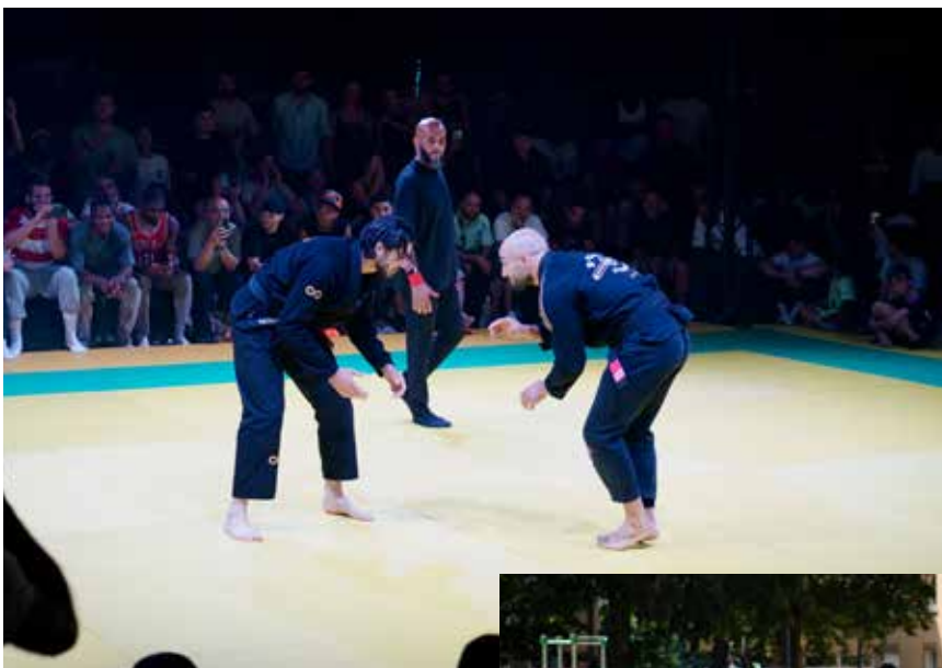
▲ Le Diamond BJJ Battle Royal 2 en a mis plein les yeux aux amateurs de sports de ju-jitsu, réunis à Joliot-Curie le 29 mai. La Z-Team s'est imposée et défendra son titre lors de la prochaine édition.