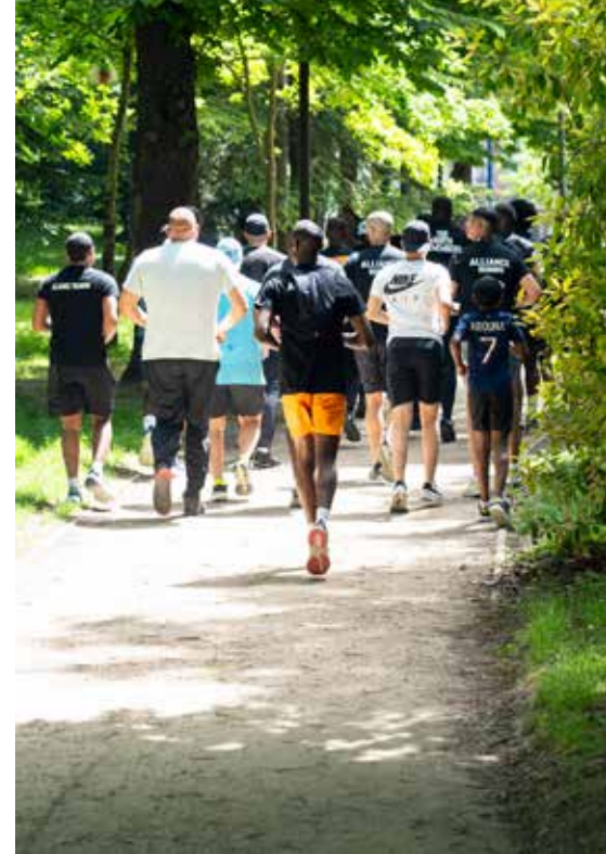
▲ La nouvelle association Alliance Training a organisé une séance de running collective. Elle promeut le sport en groupe avec pour valeurs le dépassement de soi et l'entraide.