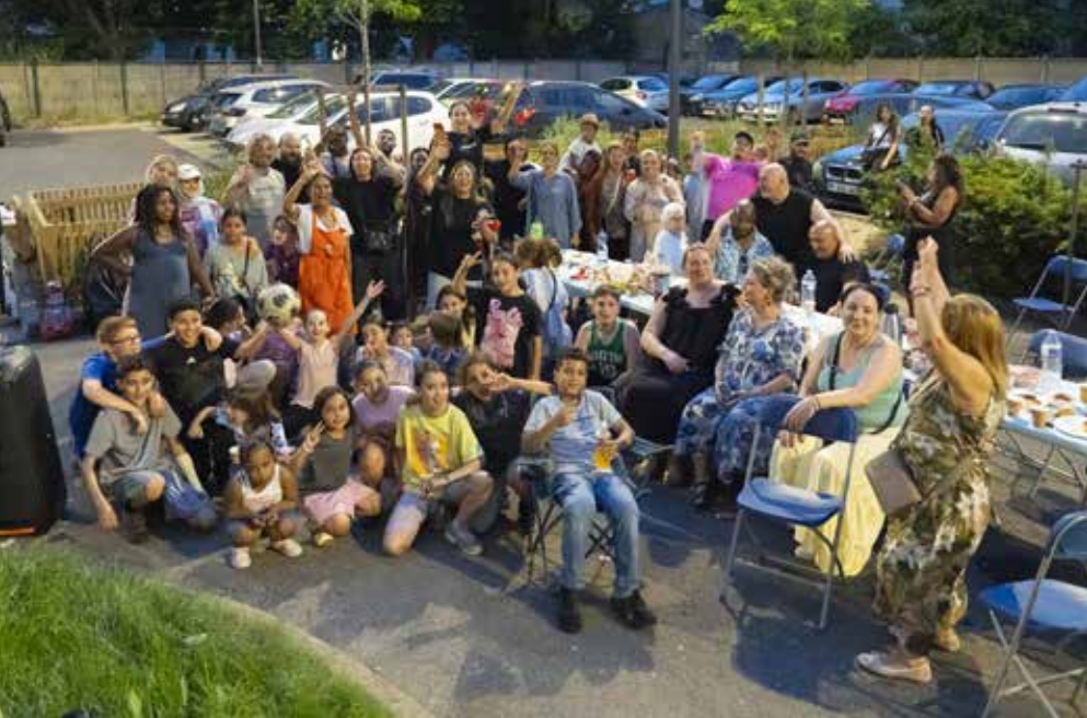
▲ La Fête des voisins est la magnifique démonstration que derrière chaque porte il y a des visages que l'on gagne à connaître. Encore une fois cette année, les Drancéens se sont retrouvés dans la rue pour partager un moment de convivialité.