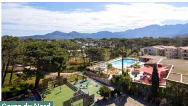
Corse du Nord