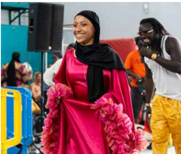
◀ Le Salon du monde organisé par L'Odyssée a mis à l'honneur les cultures et les entrepreneurs locaux autour de nombreuses animations festives.