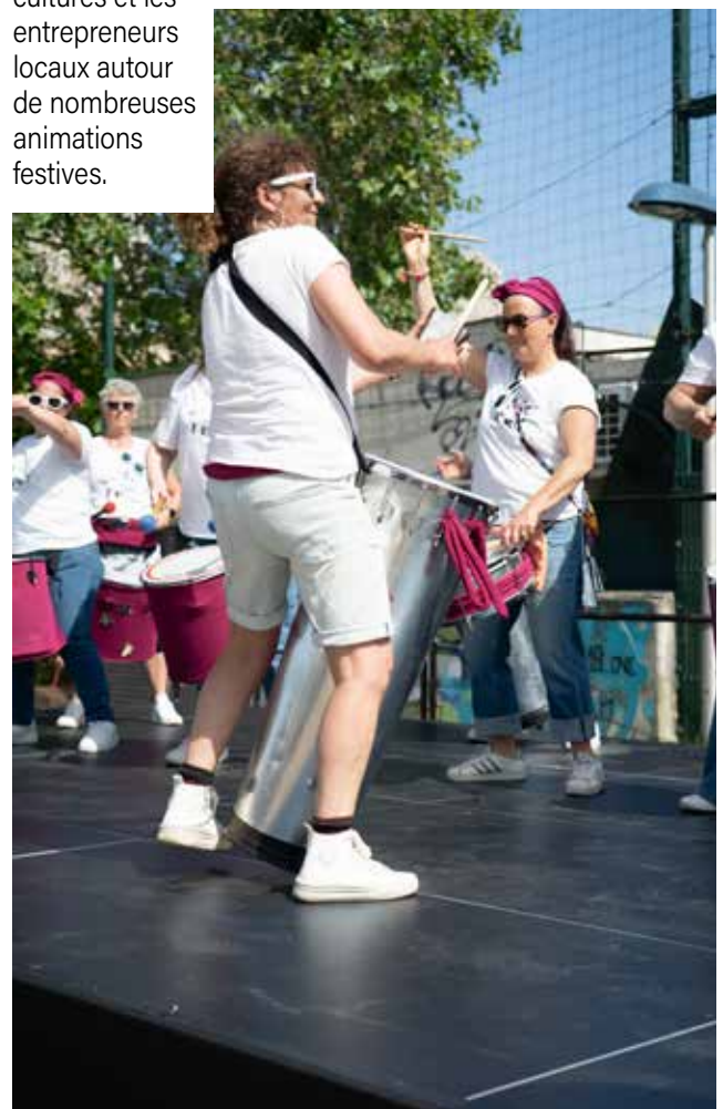
▲ Ambiance festive au sein du quartier Paris Campagne ! Sous un grand ciel bleu, de nombreux riverains se sont retrouvés le 23 mai au stade CER de la cité du Nord pour la fête du quartier.