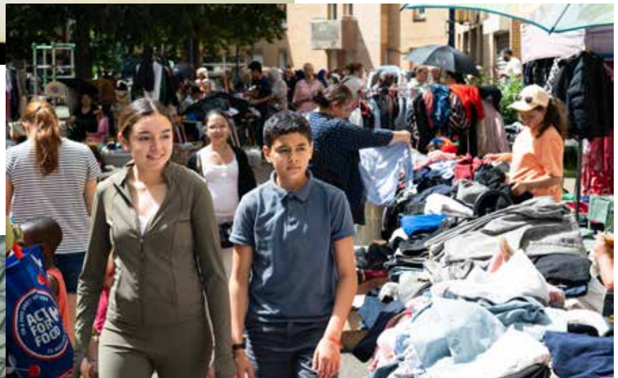
▲ Malgré la chaleur, la brocante annuelle de Double-Sens a une nouvelle fois rencontré un beau succès.