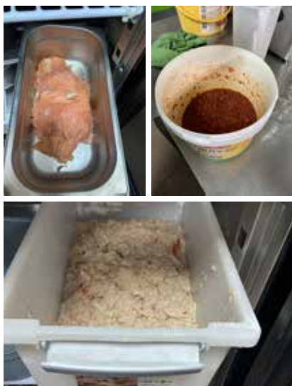
Produits périmés et température non respectée