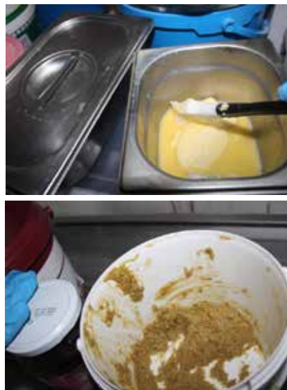
Absence de traçabilité