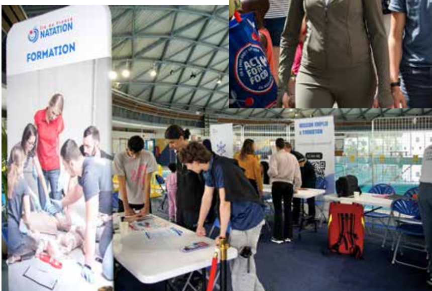
◀ L'Aquatique's Tour a fait escale à Drancy le 20 mai. Le stade nautique a reçu plusieurs organismes des métiers de la filière aquatique pour une journée dédiée à l'insertion professionnelle.