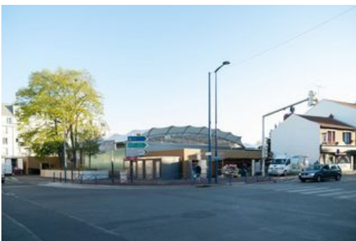
Le marché provisoire

Les habitudes y étant bien ancrées, le déménager dans un autre quartier, même provisoirement le temps des travaux, aurait été trop risqué et la clientèle n'aurait peut-être pas suivi. Et que serait devenue l'autre partie du marché, le long de l'avenue Henri Barbusse ? Durant trois années, le marché sera donc abrité sous une halle provisoire, de l'autre côté de la place du 19 mars 1962. Un tout petit exil qui a pris fin dimanche 30 novembre.