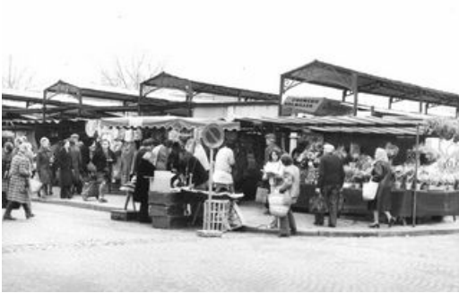
Le marché des 4 routes et son ancienne halle. Date inconnue.

C'est l'histoire d'un centenaire qui retrouve sa jeunesse. Ouvert le 1 er octobre 1922, le long de l'avenue Jean Jaurès, puis déménagé en 1927, sous une halle qui sera reconstruite au début des années 90, le marché des 4 Routes avait besoin d'un nouvel écrin. Mais dès la naissance de ce projet, il y a une quinzaine d'années, une chose est apparue évidente : il ne s'agissait pas de simplement construire une troisième halle, mais bien de réaménager totalement ce quartier, en lui insufflant une nouvelle vitalité commerciale.