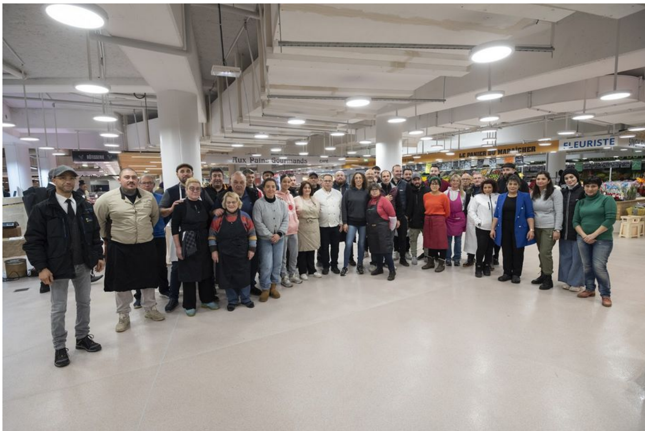
La grande famille des commerçants du marché

Il y avait néanmoins beaucoup de monde pour ce premier dimanche d'ouverture, chacun cherchant avant tout à retrouver ses étals favoris, tout en visitant les lieux. Toute la matinée, le syndicat du marché a offert des cabas de légumes aux clients et servi du vin chaud, en partenariat avec la Confrérie des enfants de la pomme de terre.