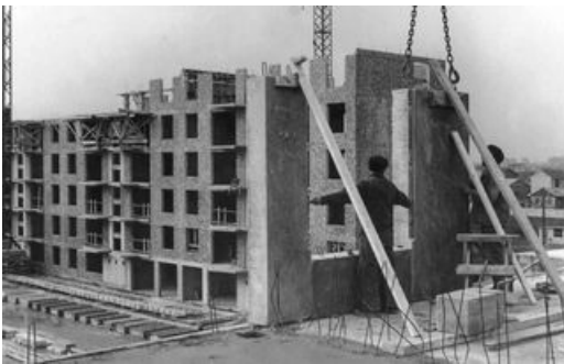
Les ouvriers assemblent les pans de murs préconstruits en usine. (1958)

Près de 4000 tonnes de matériaux seront ainsi transformées en granulats. Puisque le béton est ancien, ses propriétés seront finement analysées pour savoir dans quelle mesure il pourra être valorisé. Hier, il constituait 204 logements, demain il trouvera une seconde vie, peut-être pour soutenir les enrobés des futures rues du quartier. Mais pour l'heure, tous les regards sont braqués vers le chantier de déconstruction. Pour en limiter les nuisances, il est mené en semaine de 8 h à 18 h, et un jet d'eau réduit la propagation des poussières.