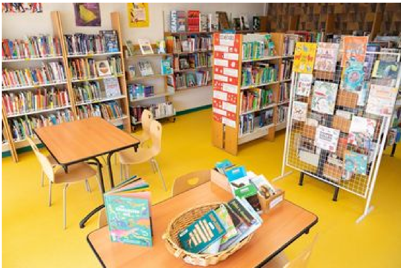
Médiathèque Bois de Groslay