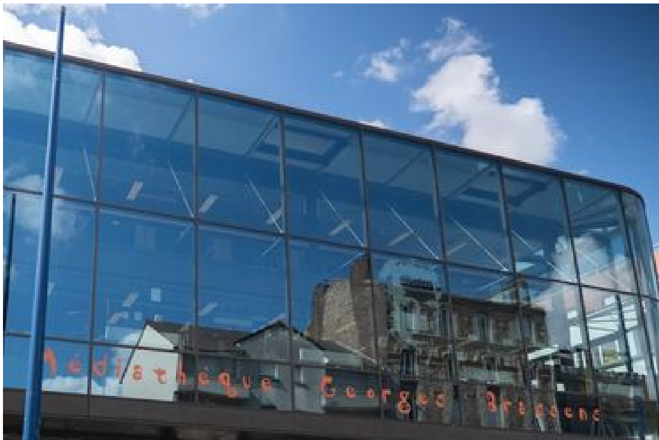
Médiathèque Georges Brassens