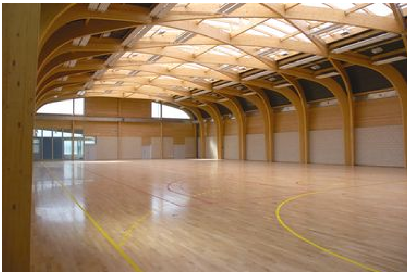
Annuaire des équipements sportifs